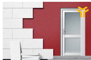
Elementmontage in der Dämmung.